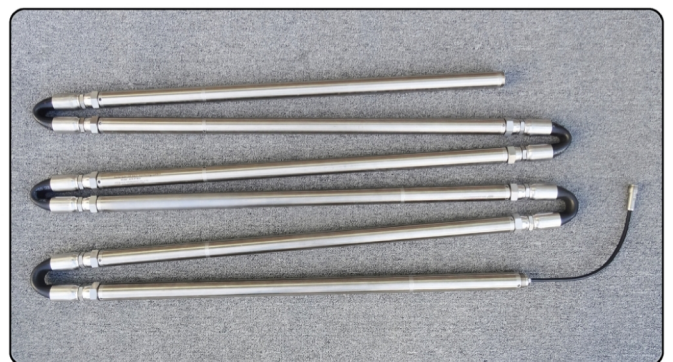
[ ACE-RTM 묶음 사진 ]

ACE-RTM은 전체 포인트의 센서가 순차 직렬통신 방식의 원라인 케이블로 연결되어 저희 회사의 ADL-200A 스마트 로거와 무선모뎀을 이용하여 원격 계측이 가능합니다.