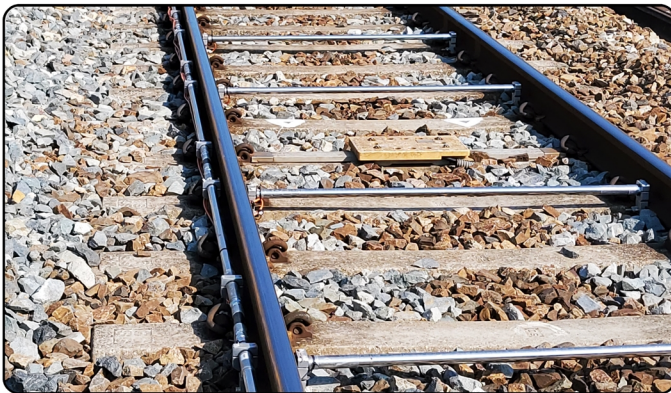
[ACE-RTM / 레일용(수평 센서 포함) 설치 사진]