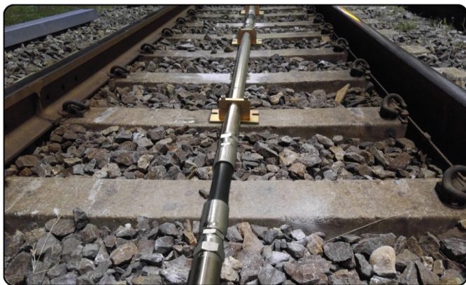
[ACE-RTM / 침목용 설치 사진]