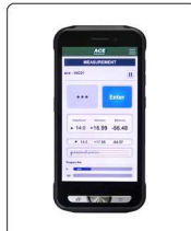
[PDA / 안드로이드 OS]