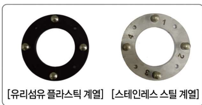
[유리섬유 플라스틱 계열] [스테인레스 스틸 계열]