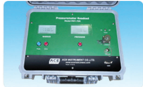
공내압력계 출력장치 (PMT-75R, Pressuremeter readout)