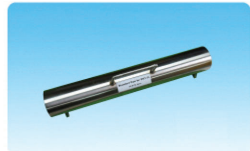
스탠다드 테스트 지그 (Standard testing Jig)