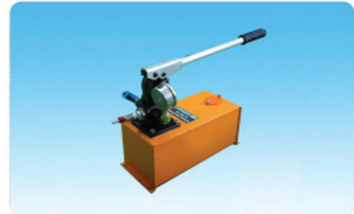
수압펌프 (Hydraulic pump)