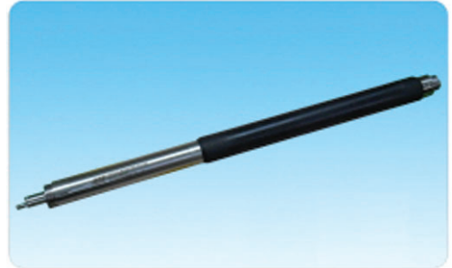
공내압력계 프로브(PMT-75, Pressuremeter probe)