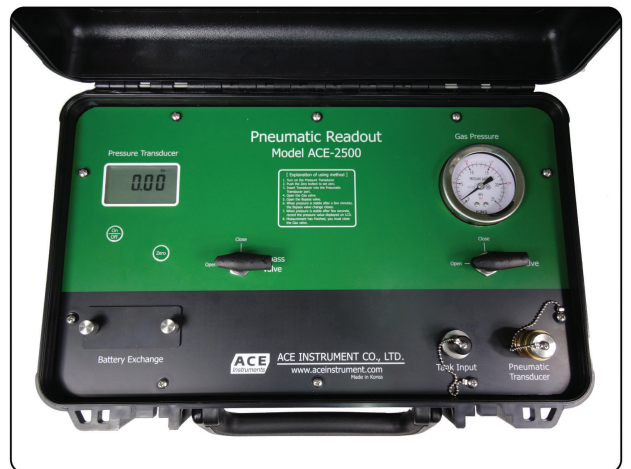
[ACE-2500 공압센서 Readout]