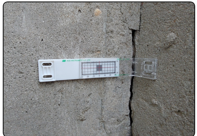
[SC-100C 모서리부 직각 설치]