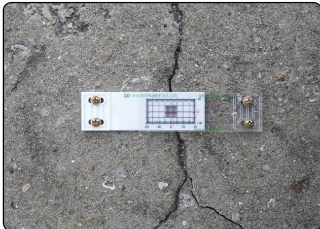
[SC-100A 바닥면 수평 설치]